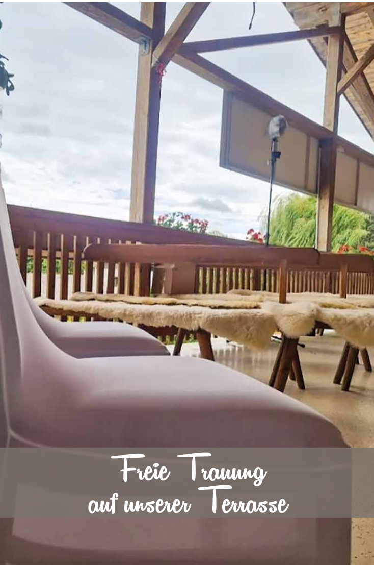
Freie Trauung auf unserer Terrasse

Für freie Trauungen stehen bei uns folgende Möglichkeiten zur Verfügung: