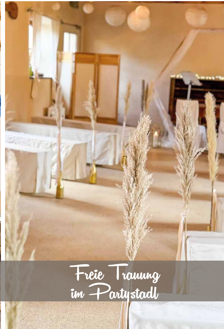
Freie Trauung im Partystadl