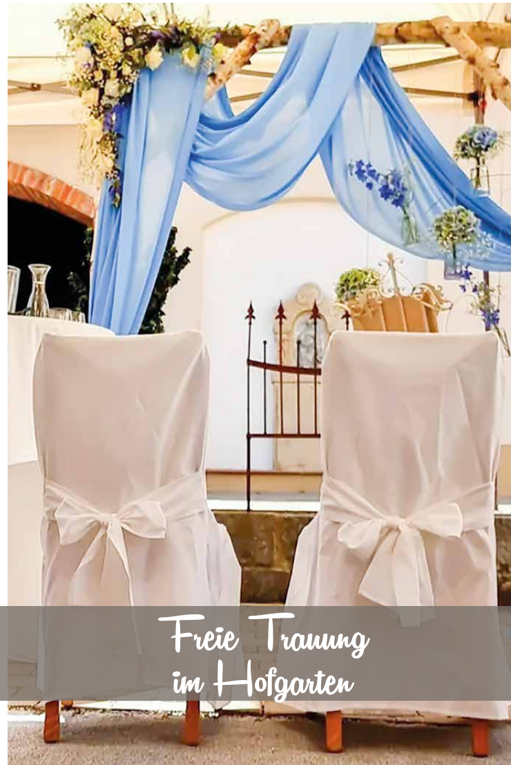
Freie Trauung im Hofgarten